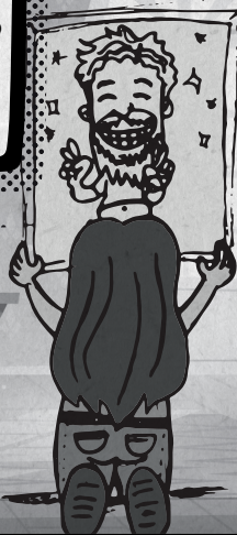
SHARIN ESPOSA DEL ROLO

POBRE MÍ MOSTO, SIN SABER NADA DE EL Y ESTE PRESENTIMIENTO TAN NEGATIVO QUE TENGO. OJALÁ ESTÉ BIEN